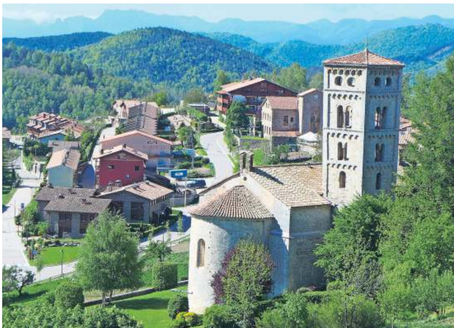
Das kleine Bergdorf Molló ist Ausgangspunkt für die Panoramawanderung.

Für die richtige Grundlage sorgt ein herzhaftes katalanisches Frühstück einschließlich Rotwein, danach kann es losgehen. Bevor man Molló verlässt, muss man allerdings unbedingt einen Blick in die Kirche Santa Cecilia werfen. Zwischen dem 11. und 12. Jahrhundert erbaut, grüßt sie schon von weitem mit filigranem Glockenturm, die bauchige Absis umschließt einen lang gestreckten Kir-